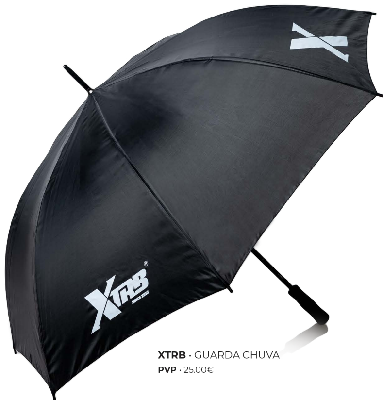
XTRB · GUARDA CHUVA PVP · 25.00€