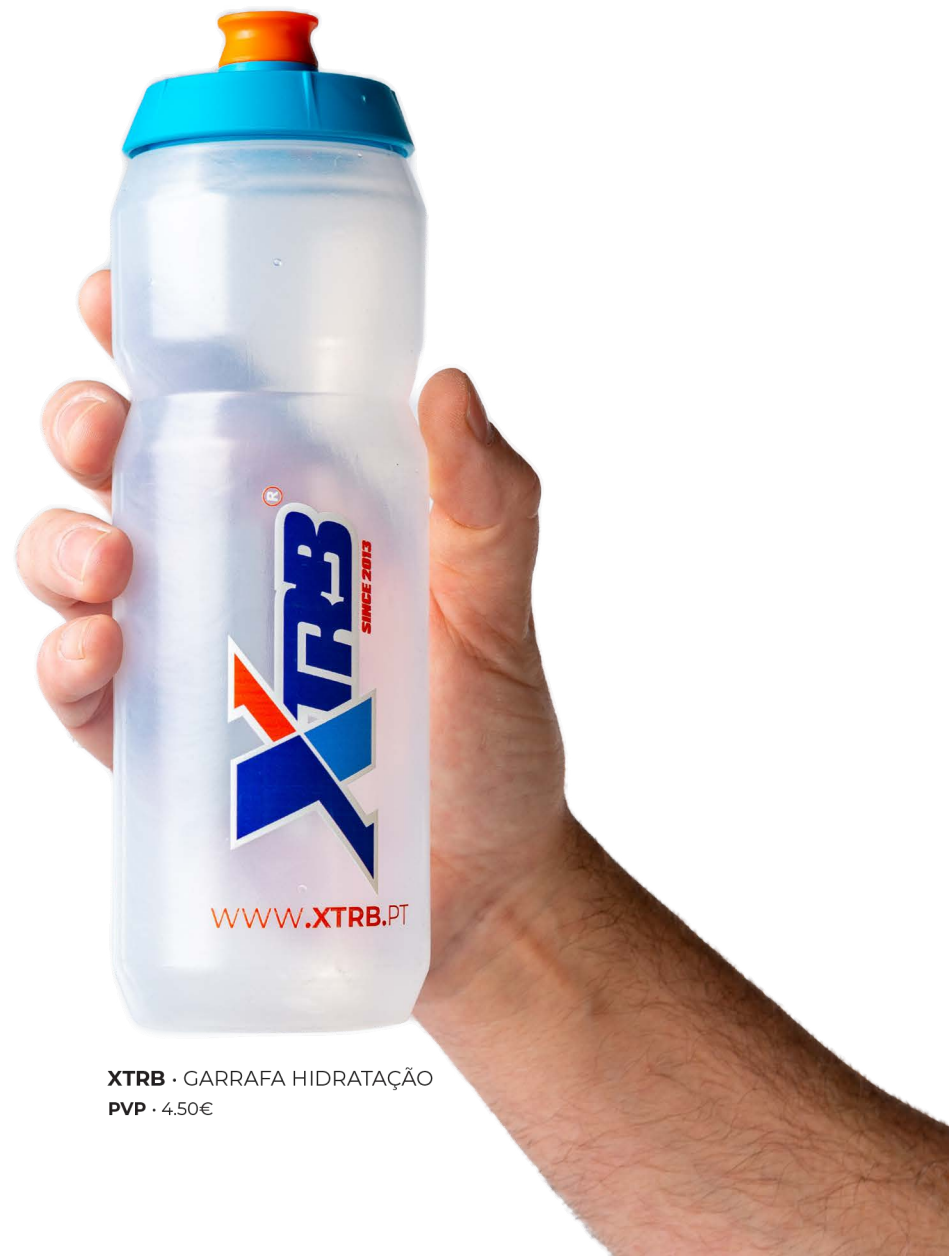
XTRB · GARRAFA HIDRATAÇÃO PVP · 4.50€